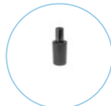
SKD 148 S X