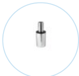
SKD 148 C X