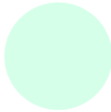
RS 100 KST. North 1 SM 110 NEW