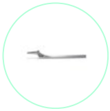
TENDO Hebel poliert