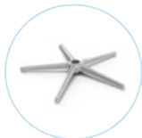
STELLAR 700 Low 5 P