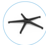
STELLAR 610 Low 5 KU