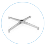
AF 294 K40 P