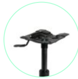
SM 15 RB