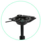
SM 15 Flex RB