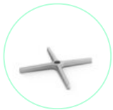
Berlin 648 P 4