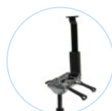
North 1 Alu-Mechanik P