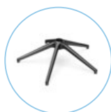
STELLAR 690 Middle 5 S