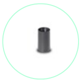
AD 38 / 50