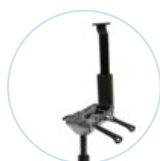
North 1 Alu-Mechanik P