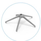
STELLAR 690 Middle 5 P